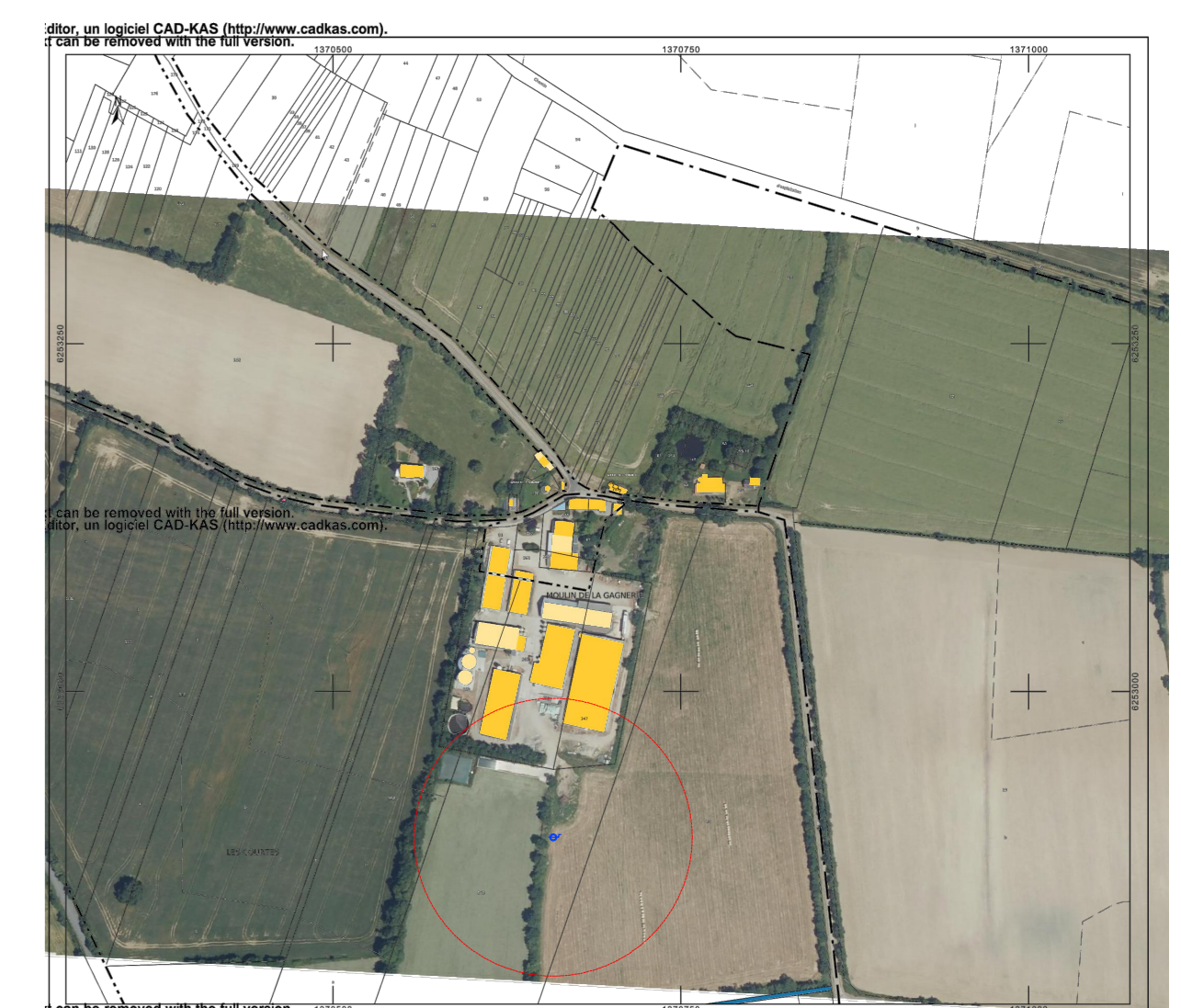
- EXTRAIT CADASTRAL - Section YA - ECH : 1:5000